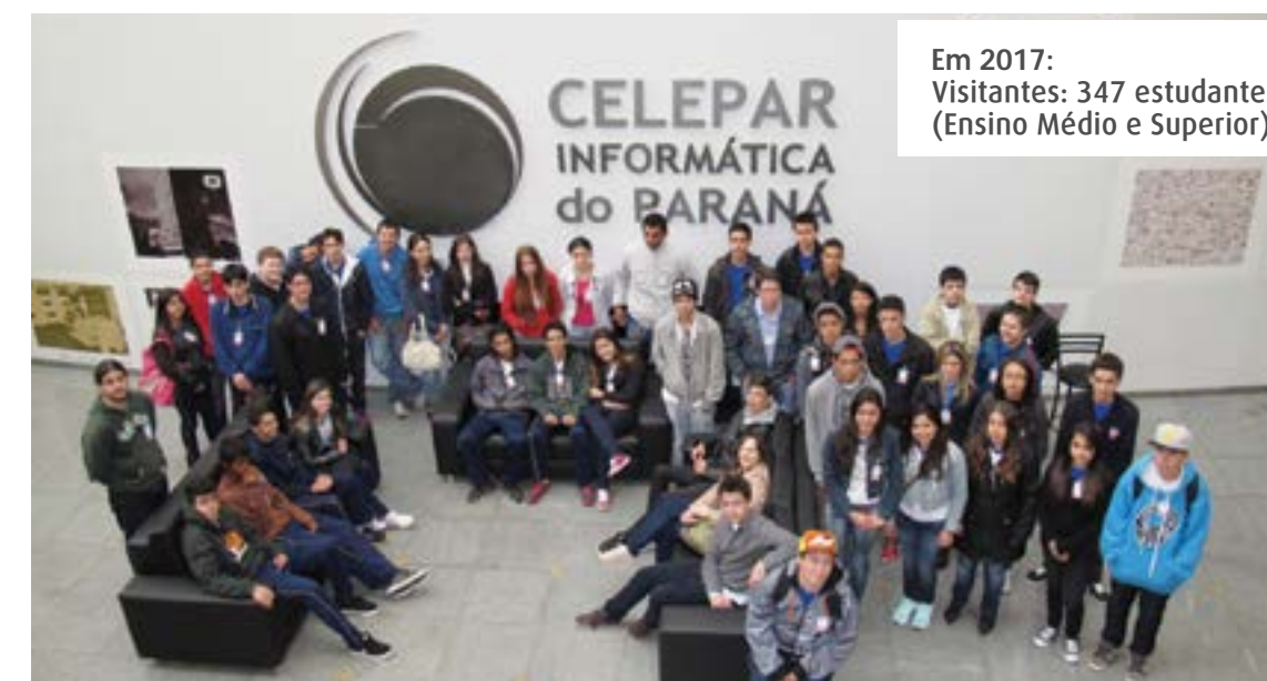
Em 2017: Visitantes: 347 estudantes (Ensino Médio e Superior).

cem as dependências da empresa, veem o vídeo institucional, conhecem o setor de help desk, o setor de operações e de produção, além de visitar o Data Center e o Centro Integrado de informações Estratégicas (CIIE).